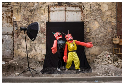
Installation du studio photo dans la ville

Chaque année, dans la ville de Jacmel au sud d'Haïti, a lieu le plus important carnaval du pays, durant les Gras. La plupart des habitants créent et renouvèlent leur costume, librement inspiré de tout ce qui traverse la réalité et l'imaginaire haïtiens. Depuis 2014, fort de ce patrimoine immatériel et artistique, Jacmel est reconnue ville créative d'artisanat et d'arts populaires par l'Unesco.